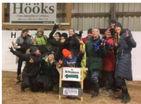
Vi kan tränga ihop fler på en bild – var med nästa gång du också!