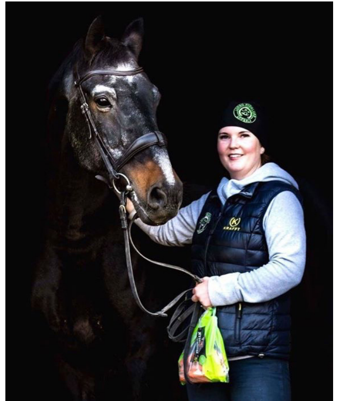
Saknad kollega. <3

• Vad händer om bommarna på hoppbanan ligger i vatten/snö en hel säsong? För vems pengar ska vi köpa nya bommar om de ruttnar? Tycker du att det saknas aktiviteter? – Ta initiativ till egna aktiviteter eller gör en insats för underhållet.