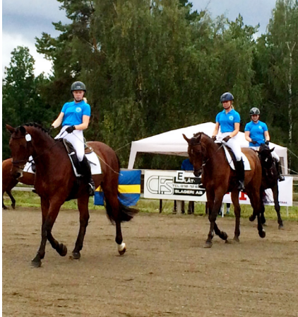
Uppvisning av våra duktiga SM-hästar Pyret, Tang, Frasse, Maja och Evita.

Detta är en samlad information från Lurbo Ridklubbs verksamhetschef med personal, Lurbo Ridklubbs styrelse samt eventuella meddelanden från de olika sektionerna. Med din hjälp och ditt engagemang strävar dessa drivande aktörer på klubben efter att bli en blomstrande och trygg ridklubb, som är ett föredöme inom svensk ridsport.